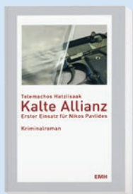
Kalte Allianz von Telemachos Hatziisaak