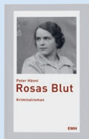
Rosas Blut von Peter Hänni