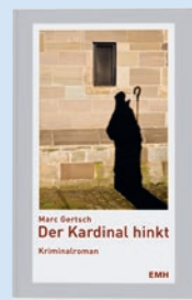
Der Kardinal hinkt von Marc Gertsch